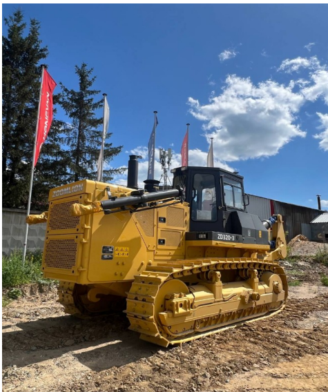
Гусеничный бульдозер Zoomlion ZD320-3