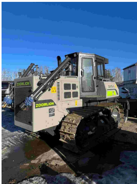
Гусеничный Бульдозер Zoomlion ZD 170-3 без рыхлителя